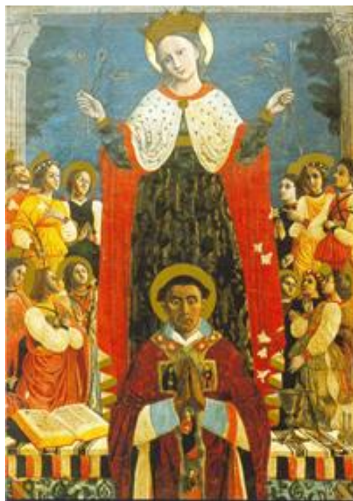
Fig. 14. Anonimo pittore tardo-gotico, Beata Vergine delle Grazie (1412). Faenza, cattedrale. Fig. 15. Pittore romagnolo (terzo quarto del XV secolo), Madonna delle frecce (1450-1475). Brisighella, Collegiata di San Michele.

Il culto della popolazione del faentino per la Madonna delle Grazie è ribadito, a pochi anni dall'esecuzione dell'affresco di Faenza, dalla ripetizione del medesimo soggetto in una tavola devozionale dipinta per la collegiata di San Michele nella vicina Brisighella (Fig. 15) 35 e trova conferma nella longevità del soggetto fino ai giorni nostri nell'ampia produzione locale di targhe votive in maiolica e vasellame ceramico 36 .