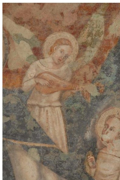
Fig. 7. Pittore marchigiano, Madonna della Misericordia (dettaglio di Fig. 6).

L'originalità dell'opera, che coniuga elementi d'iconografia tratti da differenti tradizioni pittoriche riunite grazie al fertile clima culturale assicurato dal patrocinio francescano del programma decorativo della chiesa, è garantita in maniera ancor più marcata dal complesso impianto strutturale della composizione, articolato intorno alla presenza del baldacchino mobile e alla disposizione "radiale" delle creature angeliche intorno al manto campaniforme di Maria. L'associazione figurativa alla Madonna della Misericordia dei quattro angeli cantori, che all'intonazione delle laudi sorreggono i bracci dell'elegante fastigio cortese, e del motivo degli angeli musicanti 14 , derivato dai Fioretti del santo d'Assisi, è assolutamente inconsueta per la pittura italiana, soprattutto a queste date. Il profondo sentimento devozionale delle confraternite laiche per l'immagine della Madonna Protettrice è rievocato dalla coppia di santi laterali, Francesco e Biagio, che reggono flessuosi cartigli con iscrizioni nelle quali è