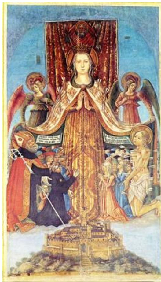
Fig. 11. Benedetto Bonfigli, Madonna della peste (1464). Perugia, San Francesco al Prato, cappella Oddi. Fig. 12. Benedetto Bonfigli, Madonna della peste (1472). Corciano, chiesa parrocchiale.

Il medesimo ruolo di intercessione per la sorte della comunità urbana affidato alla Madonna della Misericordia è riproposto negli stendardi contra pestem di Corciano, del 1472 (Fig. 12) 31 , e in quello di Montone, di un decennio successivo 32 , mentre nel gonfalone dipinto per la confraternita dei Disciplinati di San Benedetto “dei Frustati” (1471-1472) il motivo della Madonna delle frecce cede il passo ad una singolare rivisitazione dell'iconografia bizantina della Dēesis , che in questo caso contempla la Vergine, i santi benedettini ed il protettore locale ad interpersi per placare il Cristo giudice, che si accinge a castigare con le frecce la popolazione della città (Fig. 13) 33 .