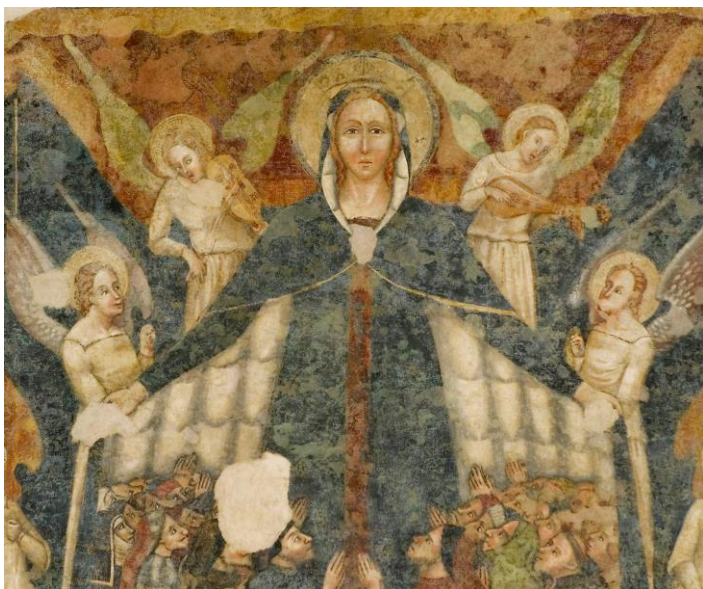
Fig. 6. Pittore marchigiano, Madonna della Misericordia , angeli musicanti e i santi Francesco e Biagio, Imola, ex chiesa inferiore di San Francesco.

potestà sovrana di Maria tra le gerarchie celesti, ragione della funzione tutelare accordatale dalla devozione fraterna, è espressa non soltanto attraverso la tradizionale monumentalità statuaria della Madonna, ma soprattutto dalla rappresentazione del capo coronato in veste di Regina Coeli , secondo l'iconografia della Vergine incoronata , motivo che nel dipinto imolese è congiunto a quello della Madonna della Misericordia , secondo una tipologia molto diffusa nella trattazione figurativa del soggetto in Emilia-Romagna.